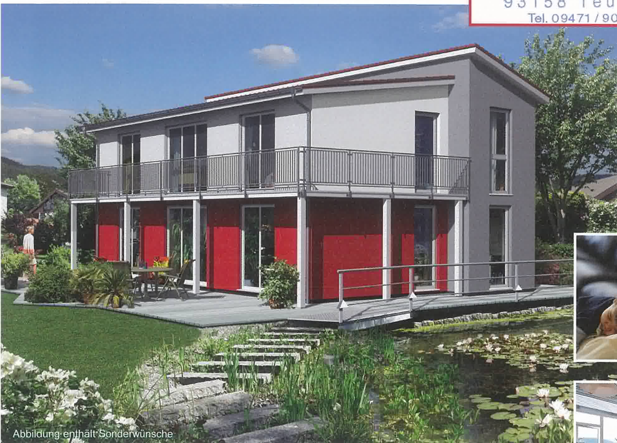
Abbildung enthält Sonderwünsche

Im Gewerbepark 6 93158 Teublitz Tel. 09471 / 90991