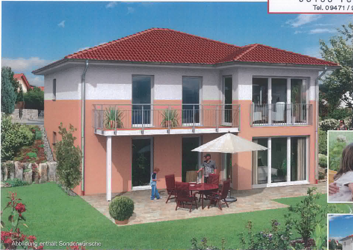
Abbildung enthält Sonderwünsche

Bauunternehmung M. Blöth GmbH Im Gewerbepark 6 93158 Teublitz Tel. 09471 / 90991